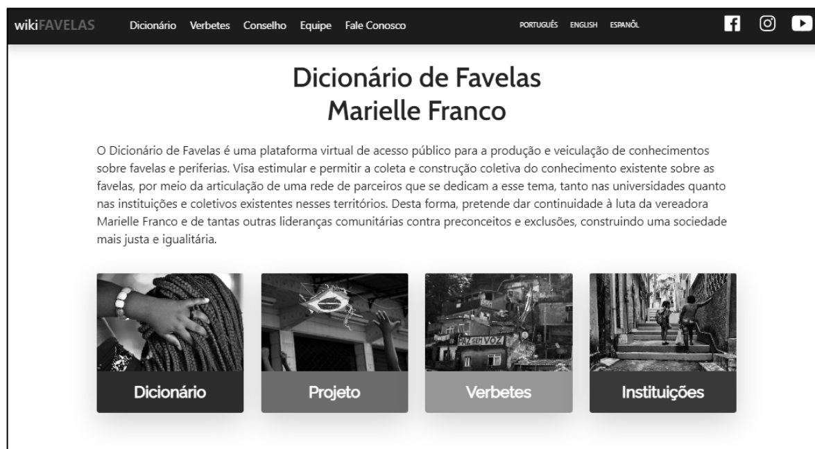
Figura 2- Página inicial do site Dicionário de Favelas Marielle Franco – Wikifavelas

Fonte: Dicionário de Favelas Marielle Franco 2 , 2020.